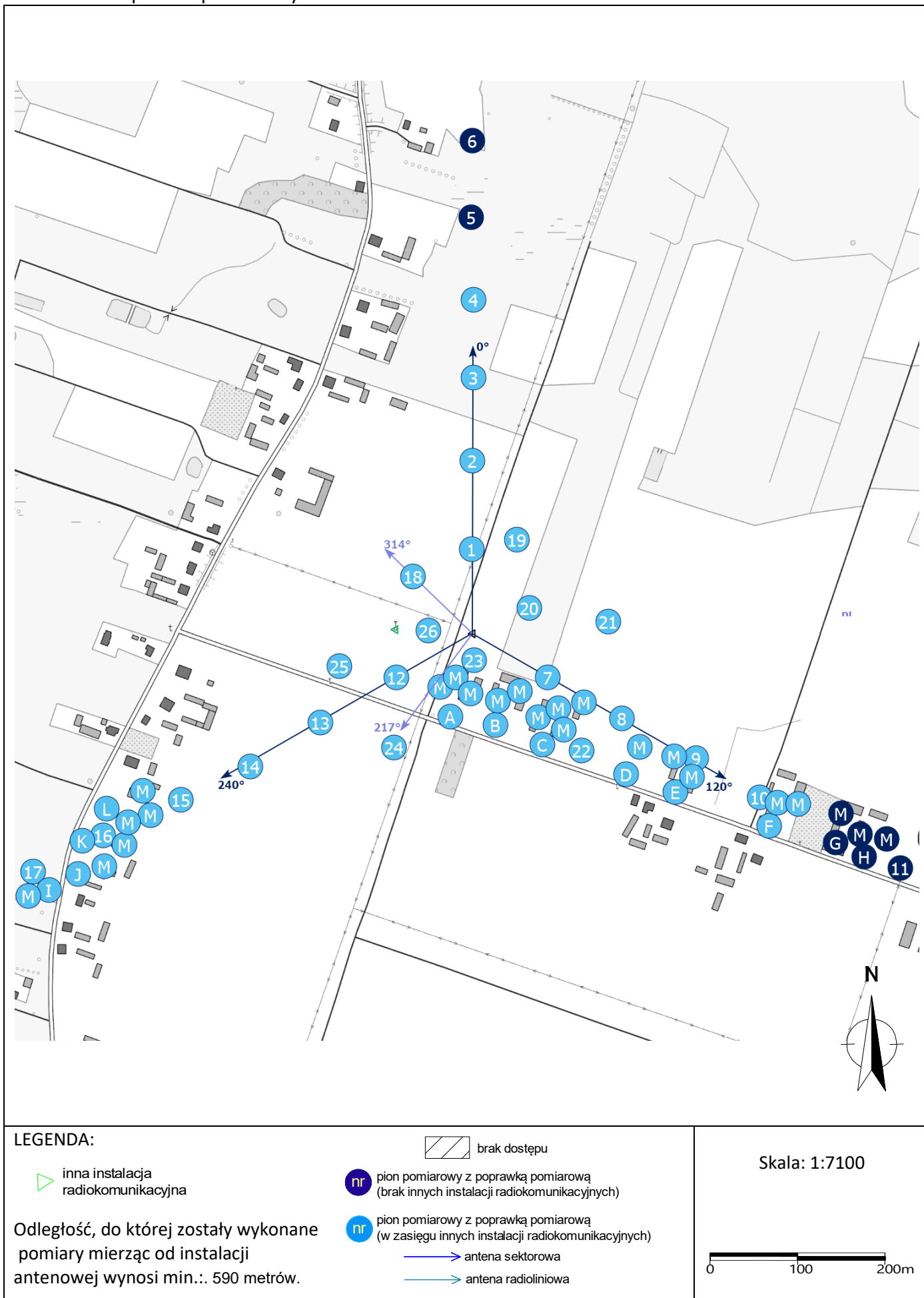
Załącznik 2. Widok pionów pomiarowych